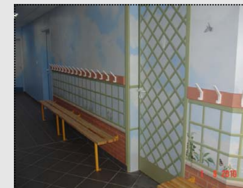
Un hall accueillant