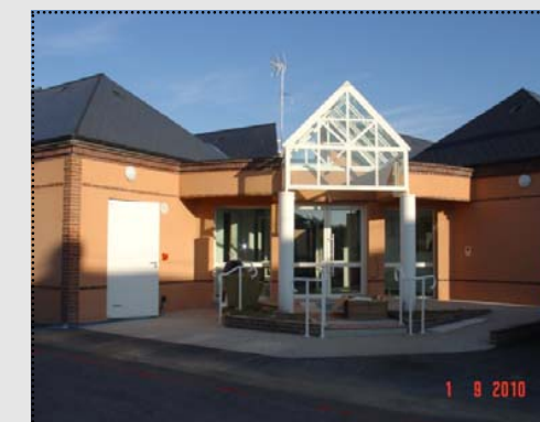
Entrée principale de l'accueil périscolaire